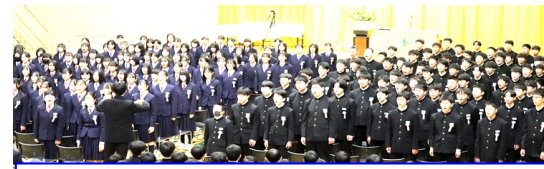
卒業生合唱「栄光の架橋」

先生方、三年間どんなことがあっても私達のことを第一に考え、学習面、生活面ともに時に厳しく、時に優しくご指導してくださり、ありがとうございました。先生方からいただいた助言はすべて私達の宝物です。在校生の皆さん、この先「楽しいな」と思うときや、困難に直面し「辛いな」と思う時がたくさんあるでしょう。ですが皆さんの周りには個性が溢れる600人の仲間、そして頼りになる先生方がいます。一人ではなく、みんなで協力して物事に取り組むことをどうか忘れないでください。それがきっと「最大の社会参加」に繋がっていくことでしょう。保護者の皆様、今日こうして無事に卒業式という晴れ舞台を迎えることができました。いつもは恥ずかしくて言えない日頃の感謝をここで伝えさせていただきます。中学校三年間に限らず、つい反抗的な態度をとって困らせてしまったことがあったと思います。ですが、いつも温かく見守り、どんな時も私達のことを信じ、応援してくれて本当にありがとうございました。最後になりますが、私達をここまで支えてくださったすべての方々と、この南町中学校に感謝し、この学舎で学んだことを深め「最大の自己実現」「最大の社会参加」を果たすことをここに誓い、答辞といたします。