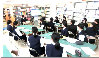
帯広柏葉高校の説明