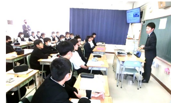
帯広大谷高校の説明

12月12日(火)、キャリア教育の一環で、高校の先生を招いて進路学習が実施されました。生徒は3つの高校を選択し説明を聞きました。質問などにも対応していただき、これからの進路を考える大切な機会になりました。40名の保護者の参加がありました。(参加高校:帯広柏葉・帯広三条・帯広緑陽・帯別清陵・帯広工業・帯広農業・帯広南商業・帯広大谷・白樺学園・帯広北・釧路高専)