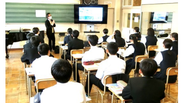
帯広緑陽高校の説明