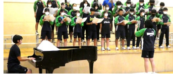
3年生 ステージでの合唱練習の様子

9月19日(火)、文化祭特別時間割がスタートしました。校舎には歌声が響き、ステージ発表の練習が躍動しています。昨年度から、全校同日に開催しましたが、他学年のステージ発表・合唱発表については教室でオンライン視聴しました。今年度は4年ぶりに全校生徒が集結しての文化祭になります。この文化祭でそれぞれの持ち味を發揮し、協働して創り上げる喜びを体感し、絆を深めてほしいと願っています。行事に向かう活動は、これからを生き抜く力につながると考えております。