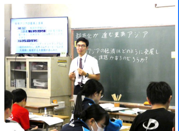
社会科授業の様子 (1-4)