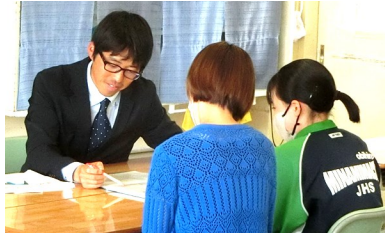
3年生三者面談より

保護者の皆様には、日頃より教育活動へのご理解、ご協力やご配慮をいただき深く感謝申し上げます。さて、体育祭が終了し、6月5日(月)～26日(月)の期間、全学年の教育相談が行われました。1・2年生は二者面談、3年生は希望により三者面談を実施しています。